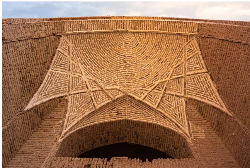
تصویر ۳. طاق

انواع طاق‌ها: در دیر گچین از انواع مختلف طاق‌ها، از جمله طاق‌های جناغی و طاق‌های گهواره‌ای استفاده شده است. هر نوع طاق دارای ویژگی‌های خاص خود در توزیع بار و زیبایی است.