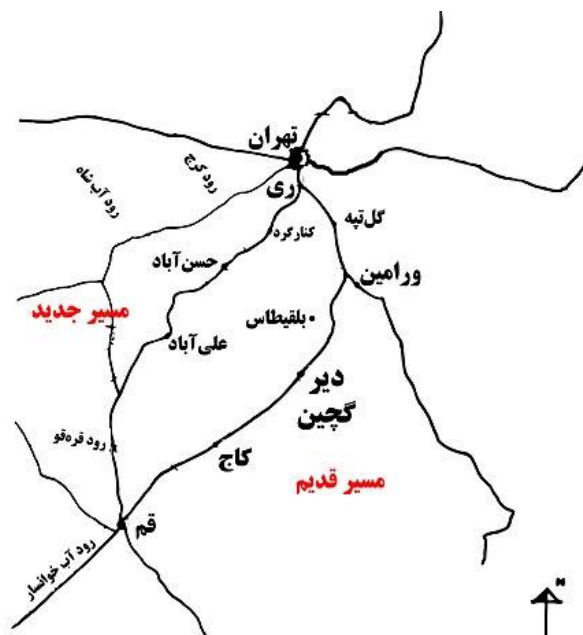
تصویر ۲ موقعیت مکانی روی نقشه

دیر گچین به دلیل موقعیت استراتژیک و نیازهای مختلف کاروان‌ها و مسافران در طول تاریخ، کارکرد چندگانه داشته است. اقتصادی: دیر گچین در مسیر جاده ابریشم قرار داشته که یکی از مهم‌ترین مسیرهای تجاری بین شرق و غرب بوده است. این کاروانسرا به عنوان یک مرکز تجاری، مکانی برای توقف و مبادله کالاهای تجاری محسوب می‌شد. بخش‌های مختلفی برای ذخیره و نگهداری کالاها در این بنا وجود داشته است.