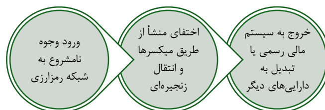
شکل شماره ۱: چرخه پولشویی مبتنی بر رمزارزها در تحلیل جرم شناختی

از منظر تطبیقی، بسیاری از نظام های حقوقی با الزام صرافی های رمزارزی به اجرای قواعد «احراز هویت مشتری» (KYC) و گزارش دهی تراکنش های مشکوک، تلاش کرده اند خلأ نظارتی را کاهش دهند (Raskin, ۲۰۱۷). فقدان چارچوب مشابه الزام آور در ایران، برای مثال در شکل ۱، موجب تمرکز تعقیب کیفری بر مرحله پسینی شده است نه پیشگیرانه.